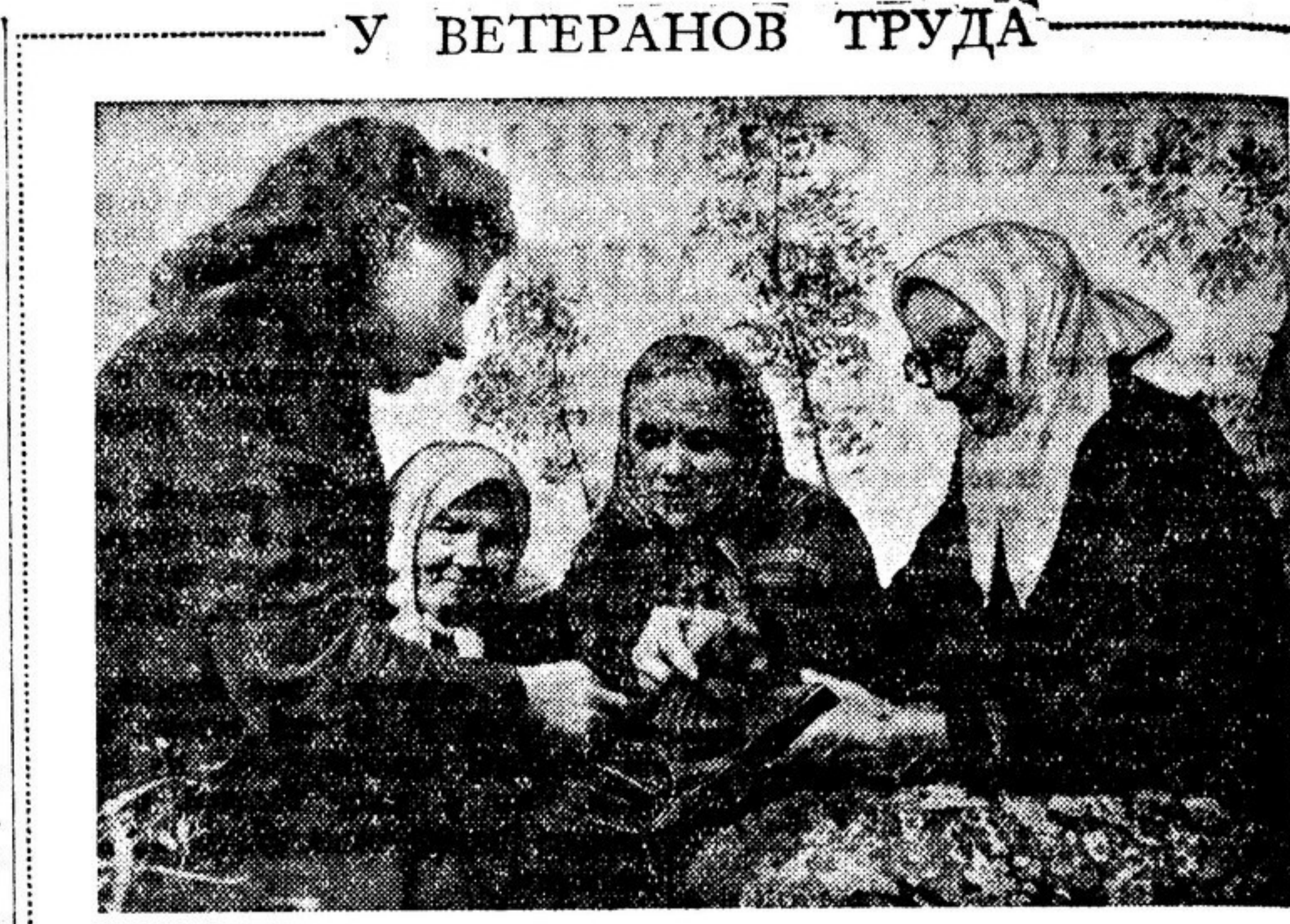
В доме для престарелых текстильщиц Московской фабрики имени Петра Алексеева живут ветераны труда, проработавшие у ткацких станков по 50—60 лет.

В доме для престарелых текстильщиц Московской фабрики имени Петра Алексеева живут ветераны труда, проработавшие у ткацких станков по 50—60 лет. В просторном помещении чисто, уютно. Мягкие опрятные постели, бесположные занавески на окнах, зеркала, шкафы, цветы. За здоровьем старых ткачих наблюдает врач. У них есть своя столовая. Несмотря на преклонный возраст, обитательницы дома не оторваны от жизни фабрики. Они — почетные гости на торжественных собраниях, постоянные посетители клуба, куда приходят послушать лекции, посмотреть кинофильм или спектакль.