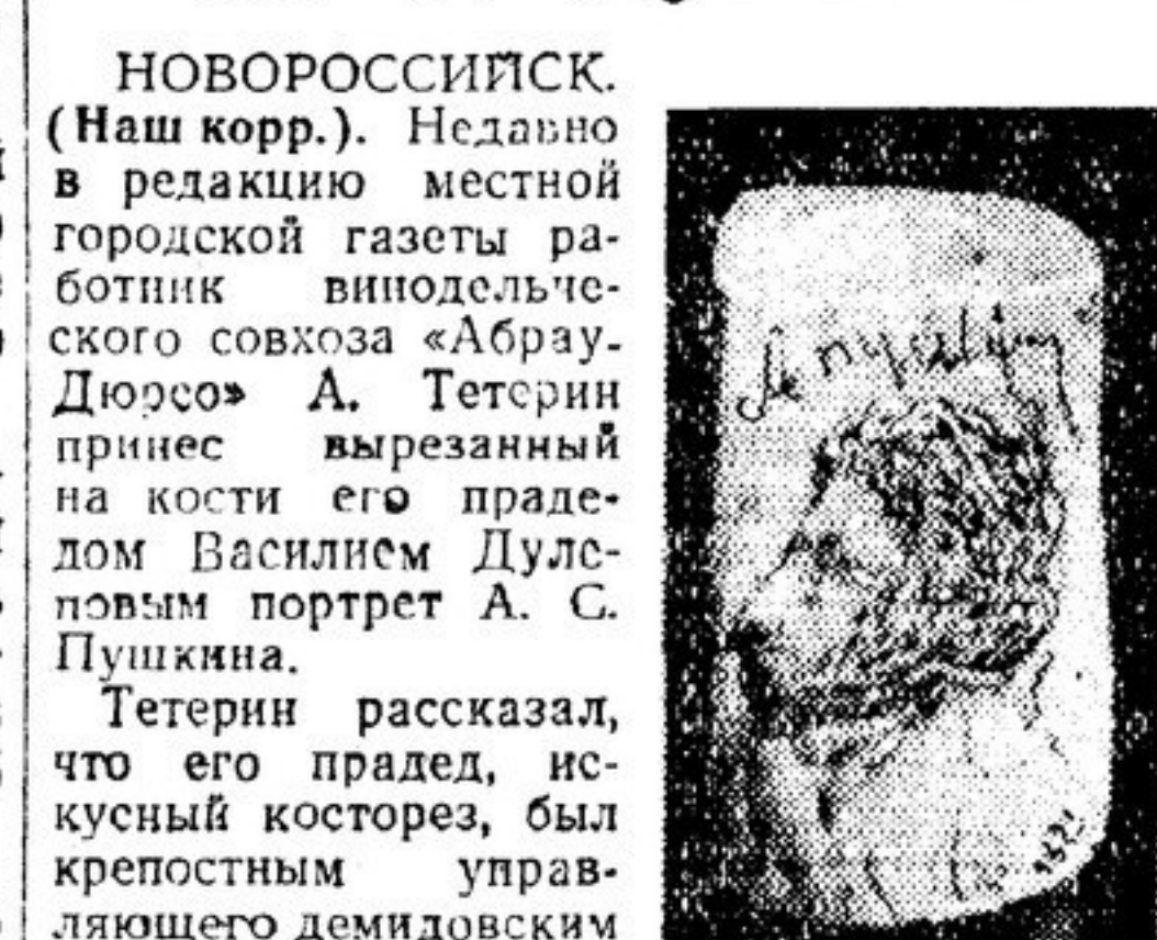
НОВОРОССИЙСК. (Наш корр.). Недавно в редакцию местной городской газеты...